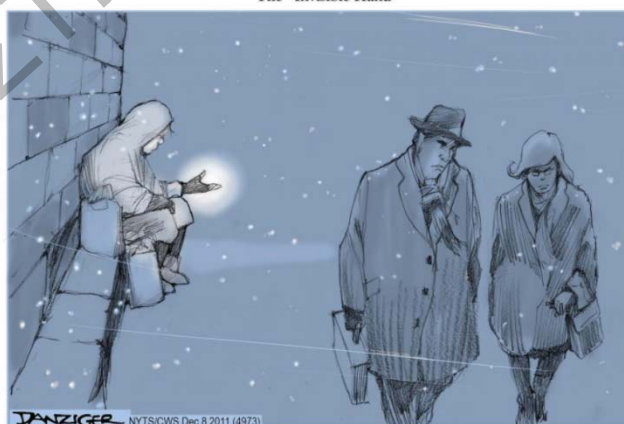
The "Invisible Hand"

Η έκθεση προσέφερε τις απόψεις 28 σκιτσογράφων, ενός ανά κράτος μέλος της ΕΕ, πάνω στις τρέχουσες προκλήσεις, τα κενά και τις προοπτικές όσον αφορά την προστασία των ανθρωπίνων δικαιωμάτων στον κόσμο. Καταγγέλθηκαν παραβιάσεις των ανθρωπίνων δικαιωμάτων και εμπόδια. Επίσης, τέθηκαν ερωτήματα για τις επιπτώσεις της άρνησης των δικαιωμάτων σχετικά με την αστική, πολιτική, κοινωνική, οικονομική και πολιτιστική ανάπτυξη. [...]